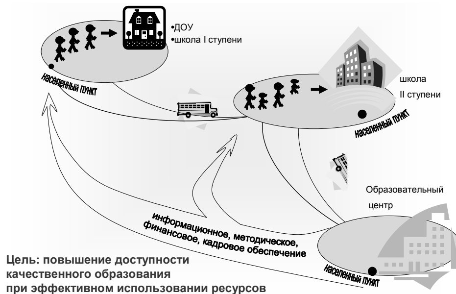
Рисунок 2. Оптимизация общеобразовательной сети

своему статусу обязана предоставить соответствующие образовательные услуги, но не имеет такой возможности ввиду отсутствия классов в младших параллелях.